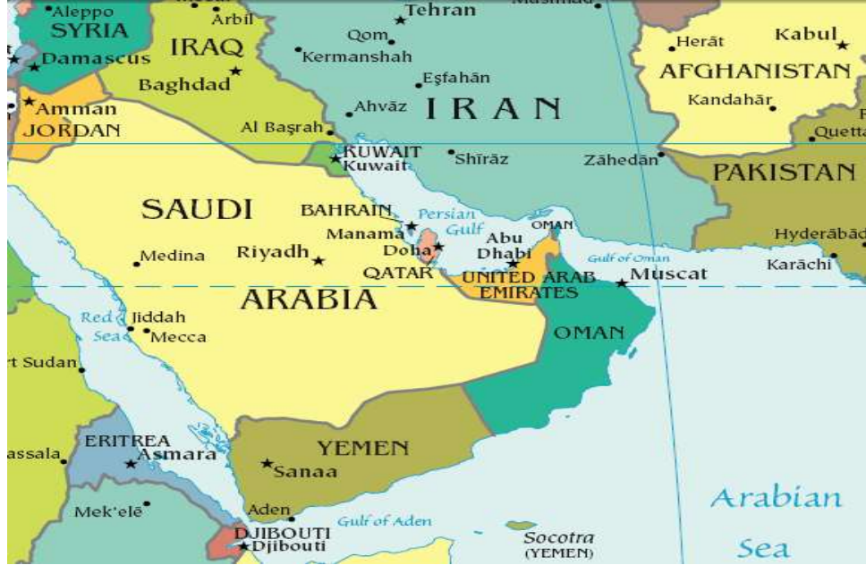
Harita 1: Basra Körfezi Ülkeleri