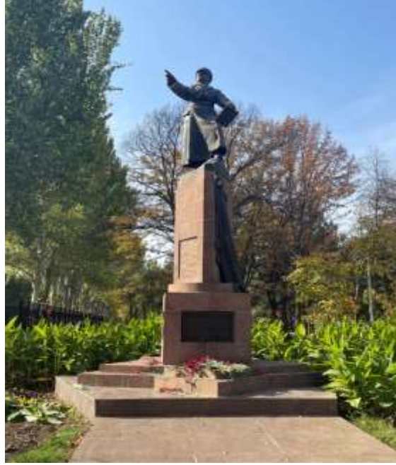
Fotoğraf 4: Bişkek'teki İvan Panfilov Heykeli

Diğer yandan gene bu parkın içinde Sovyet dönemine ait ve yapımı 1957 yılında tamamlanmış “Kızıl Muhafızlar Anıtı” bulunmaktadır ki bu sütunun üzerinde SSCB'nin simgesi hâline gelmiş olan orak çekiç bulunmaktadır. Kırmızı granitten meydana gelen bu anıtın yüksekliği ise on bir metredir. Bu sütunun kaidesinde “Sovyet iktidarı için toprağa düşenlere sonsuz minnettarlık duyguları ile” ibaresi yer almaktadır.